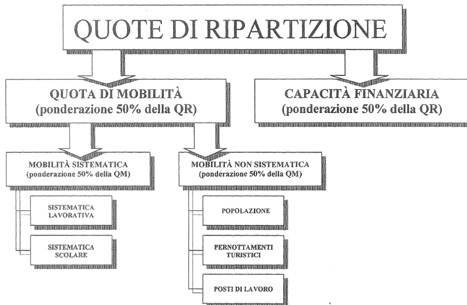
Figura 2 Costruzione della chiave di ripartizione intercomunale PTL

Il meccanismo prevede l'aggiornamento costante della chiave di riparto, a scadenze triennali, in funzione dell'evoluzione dei parametri statistici utilizzati per il calcolo.